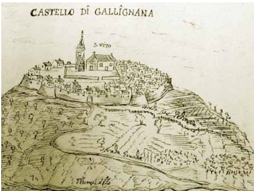
Lindar na prikazu Prospera Petronija u 17. st.

U srednjovjekovnom je gradu bilo čak sedam crkava, a sačuvane su tek četiri. Među njima je zavjetna crkva Sv. Marije koja se smatra jednom od najvrjednijih gotičkih građevina u Istri. Nalazi se na središnjem trgu, a izgradio ju je 1425. graditelj Dento ili Dente po narudžbi Petra Beračića, što je i napisano pokraj ulaznih vrata. To je jednobrodna crkvice