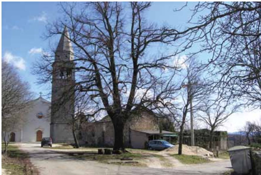
Župna crkva Sv. Mohora i Fortunata u Lindaru

nizovi dijelom izgrađeni i na mjestima negdašnjih sjevernih, zapadnih i južnih bedema.