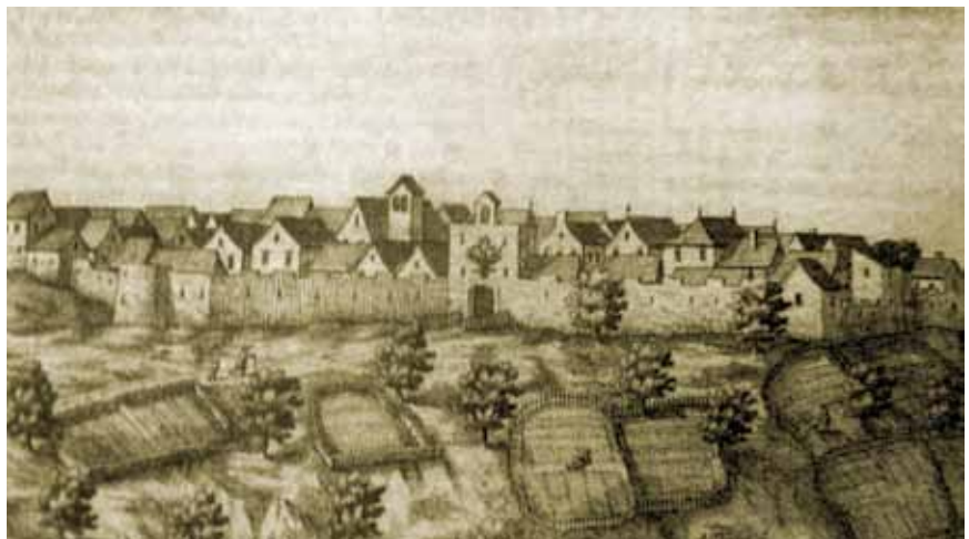
Tinjan na prikazu J. W. Valvasora

Tinjan je u 13. i 14. st. na granici akvilejskog i potom mletačkog teritorija, a gorički grof Albert IV. podigao je 1342. oko naselja nove gradske bedeme i obrambene grabe čiji su tragovi još vidljivi u organizaciji naselja. Da je dobro procijenio prilike na granici svog posjeda potvrdilo se već sljedeće godine kada je zbog stalnih čarki Pazinaca i stanovnika susjednoga Svetog Lovreča Pazenatičkog izbio rat između Goričkih grofova i Mletačke Republike. Premda se Albert IV. mirovnim ugovorom iz 1344. obvezao srušiti tinjanske utvrde, one su već 1365. bile obnovljene. Zbog toga je Tinjan potkraj vladavine Goričkih grofova i za cijele habsburške vladavine bio "trn u peti" Mletačkoj Republici, o čemu svjedoče brojne ratne epizode od 14. do kraja 16. st.