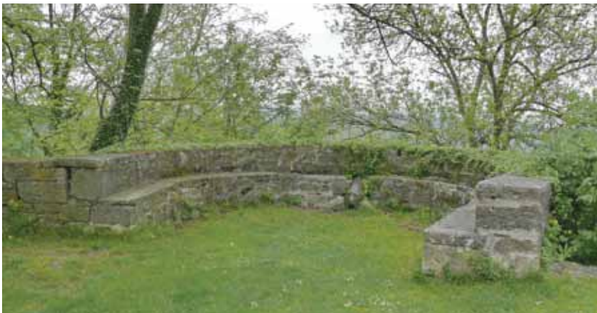
Dio lindarske utvrde s topom koji se vezuje uz kapetana Lazarića