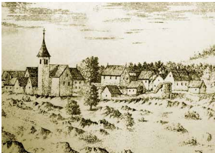
Kringa na Valvasorovu crtežu

Uz zapadni je ugao crkve samostojeći trokatni masivni zvonik pravokutnog tlocrta, natkriven poligonalnim tamburorom i osmerostranom piramidom. Visok je 30 m, a građen je od fino klesanih velikih kvadara s vijencima. Donji su mu dijelovi zvonika probijeni manjim prozorima, a najviši je kat sa zvonima na sve četiri strane otvoren biforama.