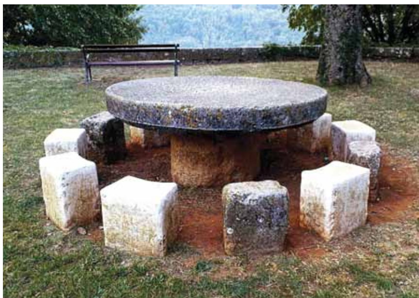
Županski kameni stol i sjedišta

sto jednokatnica podignute su barokne palače i raskošne građanske kuće. U gradskom se središtu 1783. ruše obje crkve i na tom mjestu podiže sadašnja župna crkva Sv. Šimuna i Jude u ranome neoklasicističkom stilu, a u unutrašnjosti s primjesama baroka i rokokoja. Pročelje je lezenama (s bazama i kapiteljima) podijeljeno na tri polja iznad kojih je vijenac i trokutasti zabat. U svakom je polju po jedna niša s kipovima, s tim da su bočno kipovi sv. Šimuna i sv. Jude Tadeja, a nad glavnim baroknim ulazom Blažene Djevice Marije.