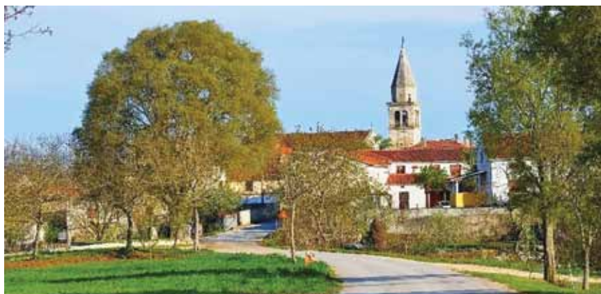
Pogled na Kringu

Osim bedema, okosnicu urbane sheme Kringe čine dvije glavne ulice, s obje strane omeđene nizovima kuća koje se protežu od negdašnjih sjevernih i zapadnih vrata te sastaju na glavnom trgu. Na trgu je cisterna s dva zdenca iz 1882. te župna crkva Sv. Petra i Pavla građena na mjestu starije. Manja je to jednobrodna građevina s malom istaknutom apsidom kružnog tlocrta te dva para plitkih kapela i sakristijom, dok je pročelje ukrašeno kipovima u nišama sv. Petra i Pavla i Blažene Djevice Marije.