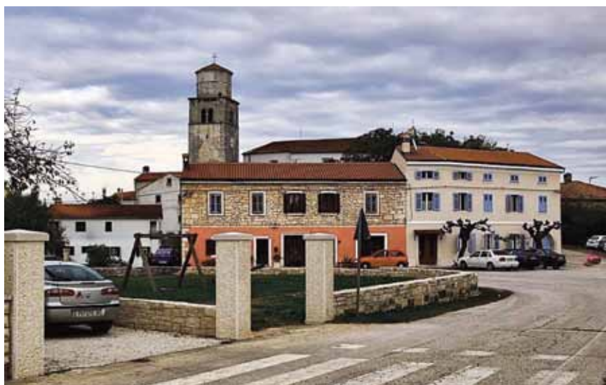
Današnje središte Tinjana

Na trgu je županski stol i 12 kamenih sjedišta i tu je redovito zasjedala tinjanska županska samouprava koja je birana jednom godišnje