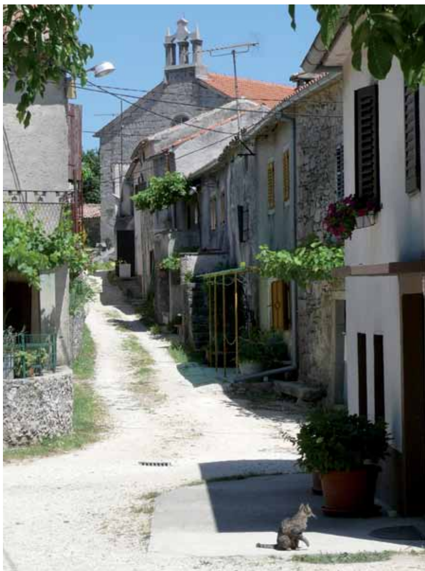
Jedna ulica u Gračišću

Na sjevernoj strani trga ostaci su ljetne rezidencije pičanskih biskupa. Izgradio ju je u 14. st. pičanski biskup Paskazije, rođeni Gračišćanin. Izvorno se taj kompleks sastojao od unutrašnjeg dvorišta okruženog stambenim i gospodarskim traktom, ali je u 16. st. srušen tako da je danas sačuvana tek kapela Sv. Antuna Padovanskog (Sv. Fabijana i Sebastijana). Izgrađena je 1381. iznad glavnoga ulaza u rezidenciju, a obnovljena 1486. Manja je to jednobrodna građevina s poligonalnom apsidom koja je nadsvođena gotičkim rebrastim svodom.