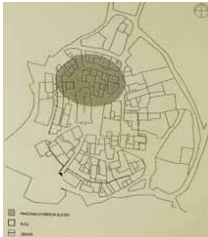
Tlocrt Tinjana (prema K. Horvat-Levaj)

Poput brojnih drugih istarskih naselja razvio se na mjestu prapovijesne histarske gradine, na istaknutom položaju nad jednim od glavnih putova. Sudeći prema rimskom nazivu Attinianum, koji vjerojatno potječe od imena rimskog veterana kojem je pripadao, život je ondje postojao tijekom cijele rimske vladavine iako se nesumnjivo dio stanovništva bio iselio i podigao nova naselja u široj okolici. Što se potom događalo, danas je potpuna nepoznanica, no sasvim je sigurno na istom mjestu u srednjem vijeku izgrađeno novo naselje koje se u dokumentima prvi put spominje 929. kada zajedno s Motovunom prelazi iz vlasti Otona II. Saskog na Porečku biskupiju. Sredinom je 12. st. sjedište župe koja se u dokumentima prvi put spominje 1177. kao "ecclesia di Antoniana". U posjedu je Porečke biskupije bio do kraja 12. st. kada mu je gospodarom postao već spominjani Meinhard, utemeljitelj Pazinske grofovije i knežije.